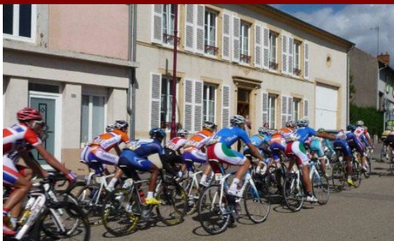
Le peloton dans la rue Charles de Gaulle

Le Tour de l'Avenir est passé à Béchy le 5 septembre 2011, en début d'après-midi, venant de Luppy pour rejoindre Moncheux. Les jeunes coureurs cyclistes, apparemment aussi véloces que leurs aînés du Tour de France, ont été applaudis par les élèves de l'école primaire et les villageois informés. Par sécurité, et David TARIS, employé municipal, avaient installé des barrières pour interdire tout accès au parcours depuis les rues adjacentes.