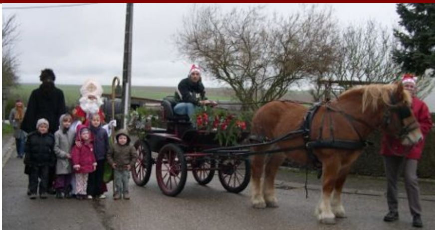
Saint-Nicolas, Père Fouettard et leur attelage

Cette année, Saint-Nicolas et le Père Fouettard ont visité le village avec sa calèche. Le 4 décembre dernier, il a bravé le vent et la pluie avec son attelage pour aller chercher les enfants de Béchy et les emmener à la salle du Foyer Socio Educatif. Une fois au chaud, les enfants ont été accueillis avec une petite séance de cinéma, avant de se voir récompensés par un cadeau remis en main propre par le vieux barbu. Pendant la distribution des cadeaux, un goûter a été