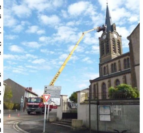
Travaux sur la toiture de l'église

Les prochains travaux prévus consisteront à réparer la charpente qui supporte les cloches. Cette structure présente des signes de faiblesse important dû au vieillissement du bois. Cette tâche confiée à l'entreprise BODET est reportée à l'an prochain.