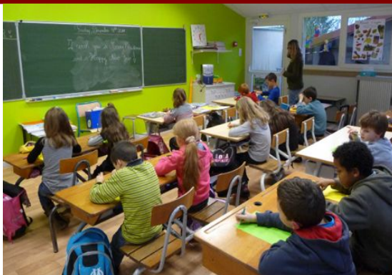
Leçon d'anglais dans l'une des nouvelles classes