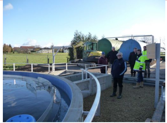
L'équipe municipale devant le nouvel ouvrage

Le nouveau clarificateur de la station d'épuration est en fonctionnement. Les clôtures définitives avec un grillage à 2 mètres seront réinstallées prochainement. La réception finale a été prononcée le lundi 5 décembre au matin en présence du maire et son 1 er adjoint, du bureau d'étude LVRD maître d'œuvre, de SATESE spécialiste des stations d'épuration qui contrôle le bon fonctionnement par des mesures annuelles, d'HYDREA ingénierie de stations, de d'ALBIZATTI entreprise TP du bassin. Le projet initial a été complété par la réalisation d'options qui se sont avérées judicieuses pour minimiser les coûts d'entretien : le carrelage de la piste de nettoyage en périphérie du bassin ainsi que la mise aux normes de toutes les commandes électriques vieilles de 40 ans. Le volume du bassin d'aération est augmenté de 30% ce qui réduit le besoin en oxygène (DBO) des rejets au milieu naturel. La surface du bassin de clarification, point critique de l'ancienne installation,