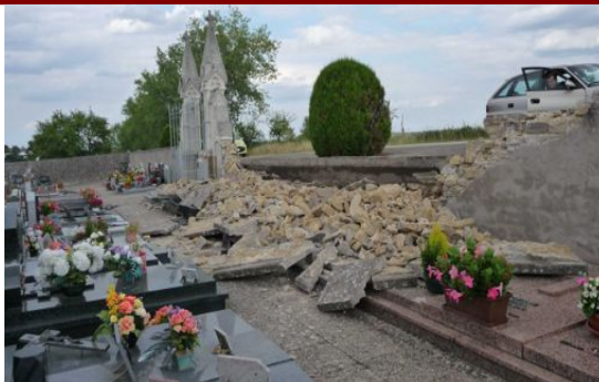
Le mur du cimetière écroulé

Le mur du cimetière percuté en juillet dernier sera reconstruit dès que les assurances recevront les rapports d'expertise pour statuer. L'automobiliste maladroit à l'origine de la chute du mur, n'est toujours pas identifié. La réparation des importants dégâts causés sur les monuments funéraires en contrebas ne pourra logiquement être entreprise qu'après reconstruction du mur. Les propriétaires inquiets ont reçu un dossier explicatif de la mairie. Celle-ci s'efforce de préparer au mieux le chantier de reconstruction, pour que les travaux puissent être rapidement entrepris aussitôt que l'assurance aura traité le dossier.