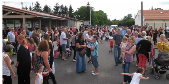
La fête des écoles le 27 Juin 2014

L'AEN c'est aussi : la fête du jeu, Halloween, des sorties extra-scolaires, un repas de carnaval, un spectacle de Noël pour les élèves, et cette année une participation à la sortie classe verte à hauteur de 75 € par enfant. Avis aux bonnes volontés : venez nous rejoindre au sein du comité, ou nous donner un coup de main ponctuellement lors de nos manifestations.