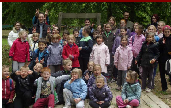
La sortie au TIPIPARK

Pour clôturer l'année scolaire, la fête de l'école a eu lieu le vendredi 27 Juin. Le spectacle des maîtresses a été suivi par les numéros de cirque des enfants de la